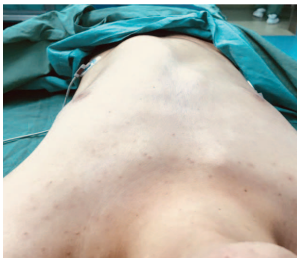
Figura 1. Pared torácica anterior.

Se trató de un paciente masculino de 17 años, ASA 1, con un peso de 60kg y un IMC de 19; antecedentes de