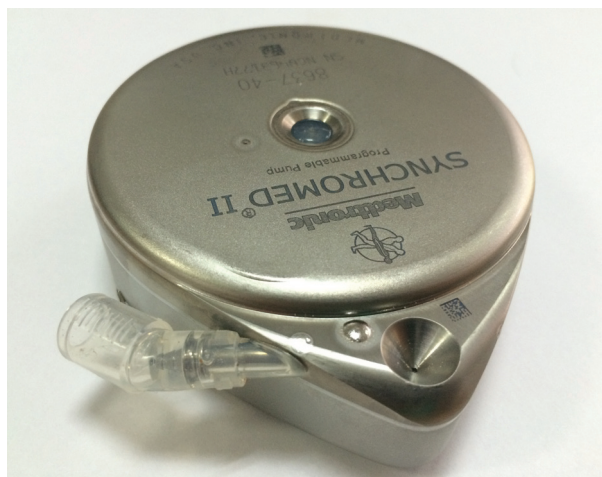
Figura 1. Bomba Intratecal SynchroMed II de Medtronic.

En junio de 2011, se propuso la optimización analgésica con la implantación de una bomba intratecal SynchroMed II 8637-20 (reservorio de 20 mL, catéter 870950) (Figura 1), con mejoría de los síntomas. Actualmente, en manejo con hidromorfona intratecal 349.7 µg/dl con intervalo de relleno de 102 días, adecuada modulación del dolor sin efectos adversos. Durante la recarga se utilizaba la plantilla suministrada por el proveedor, con la necesidad